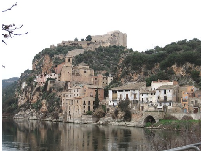
Imatge de L'Ebre i del castell de Miravet

Itinerari: Sortida amb autocar a les vuit del matí de davant de l'estació del carrilet en direcció a la Terra Alta, parant per esmorzar en una àrea de l'autopista (a compte de cadascú). Després d'esmorzar, passant per Mora d'Ebre, ens dirigirem a Miravet, on farem una parada per fer (a peu pla) unes fotos al riu i al castell, reprenent el viatge fins a Pinell de Brai, on farem una visita guiada pel seller modernista, obra de Cèsar Martinell (deixeble de Gaudí, i també arquitecte del celler que vàrem veure, a Nulles, l'any passat) Després de la visita al celler, farem un tast de vins de la Terra i ens dirigirem a un restaurant de Gandesa, on farem el següent àpat, a elegir: