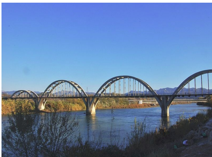
Vista del pont i del riu, des de Mora d'Ebre

Acabat el dinar i després d'una petita sobretaula anirem a "estirar les cames" tot fent una visita al museu de Gandesa o a veure un paratge amb unes precioses vistes a l'Ebre. Un cop finalitzada aquesta visita tornarem cap a Sant Boi, on pensem arribar al voltant de les set del vespre.