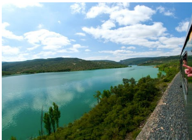
Pantà de Sant Antoni, vist des del mateix tren

Per a inscripcions a la llibreria Isart (plaça Presas): a partir del dijous dia 14 d'abril.