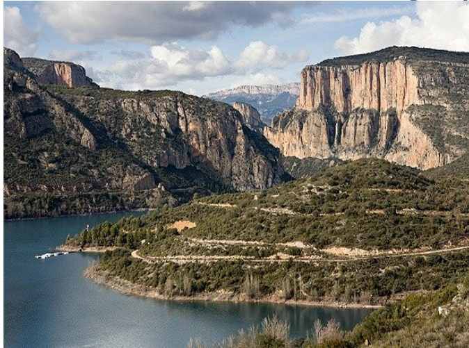
Pantà de Camarasa

Itinerari: Sortida amb autocar a dos quarts de vuit del matí (7 h. 30 min.) , de davant de l'estació del carrilet, en direcció a Lleida, parant per esmorzar (inclòs en el preu). Prosseguint, després, fins a l'estació de la capital de la Terra Ferma, allà agafarem un tren automotor modern que ens portarà per uns paratges impressionants, travessant diversos pobles i quatre pantans: Sant Llorenç de Montgai, Camarasa, Tarradets, i Sant Antoni, fins arribar a la Pobla de Segur. Allà ens esperarà l'autocar i un guia local per fer una visita pels llocs més emblemàtics de La Pobla. Finalitzada la visita anirem al restaurant per fer el següent àpat: