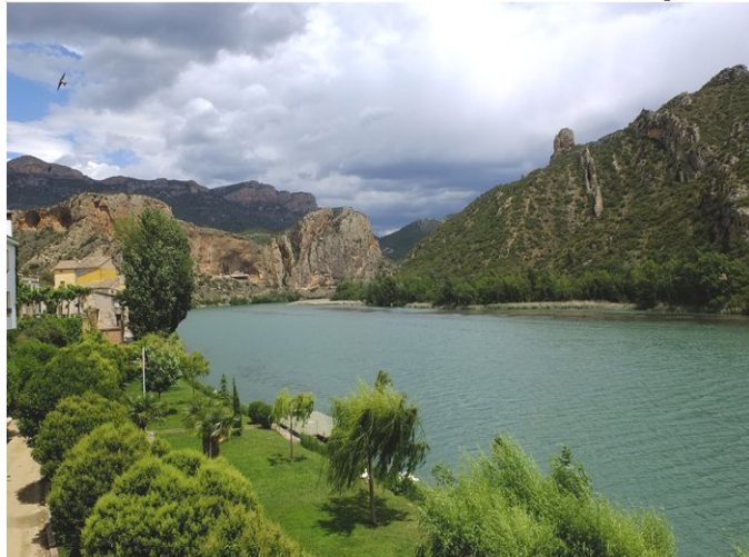
Pantà de Sant Llorenç de Montgai