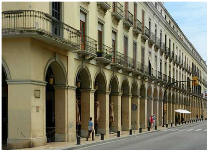
Zona modernista de la Bisbal d'Empordà