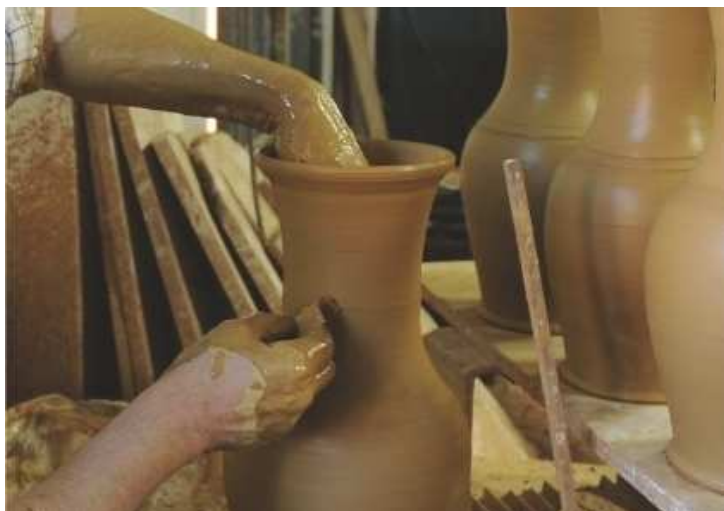
Indústria de la ceràmica Bisbalenca

Ben dinat, després d'una mica de sobretaula, i per estirar les cames, anirem a fer una petita passejada per la zona turística i per la platja. Després de fer la passejada reprendrem el viatge de tornada fins a Sant Boi, per arribar prop de les set de la tarda.