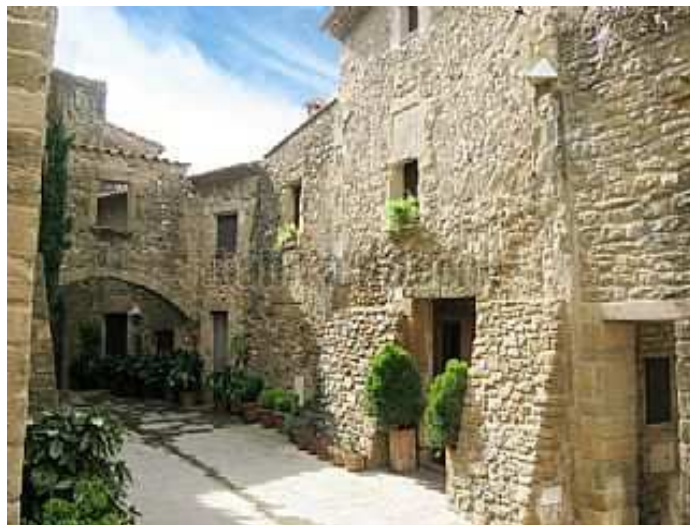
Nucli antic de La Bisbal

Itinerari: Sortida amb autocar a les vuit del matí, de davant de l'estació del carrilet, en direcció al Baix Empordà, parant per esmorzar en un àrea de l'autopista (no inclòs en el preu). Prosseguint, després, fins a La Bisbal per visitar una important fàbrica de ceràmica, i el centre històric de la ciutat que fou una de les primeres poblacions de l'Empordà. Amb la construcció de l'església de Santa Maria i, més tard, del Castell, aquesta vila es convertí en un nucli urbà. Actualment, el nucli antic, conserva un ric patrimoni arquitectònic. L'entremat de carrers estrets i els nombrosos edificis antics mostren l'estructura primigènia de la vila i el traçat de les antigues muralles. Acabades les visites anirem a un restaurant de la Costa Brava per fer el següent àpat: