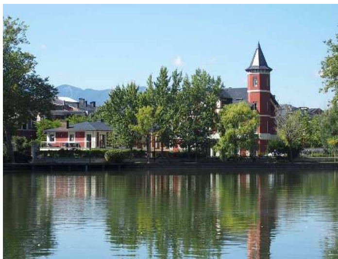
Una vista del llac de Puigcerdà

Preu (inclòs viatges, dinar i visites): socis 40€ / No socis 43€ ( porteu el DNI el dia de l'excursió )