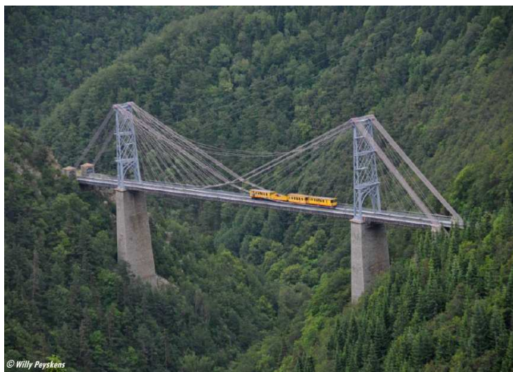
El tren groc passant pel pont penjat Gisclard

Acabat el dinar i després d'una petita sobretaula anirem a "estirar les cames" i fer una petita visita pel llac de Puigcerdà, un cop acabada, tornarem cap a Sant Boi, per arribar prop de les set del vespre.