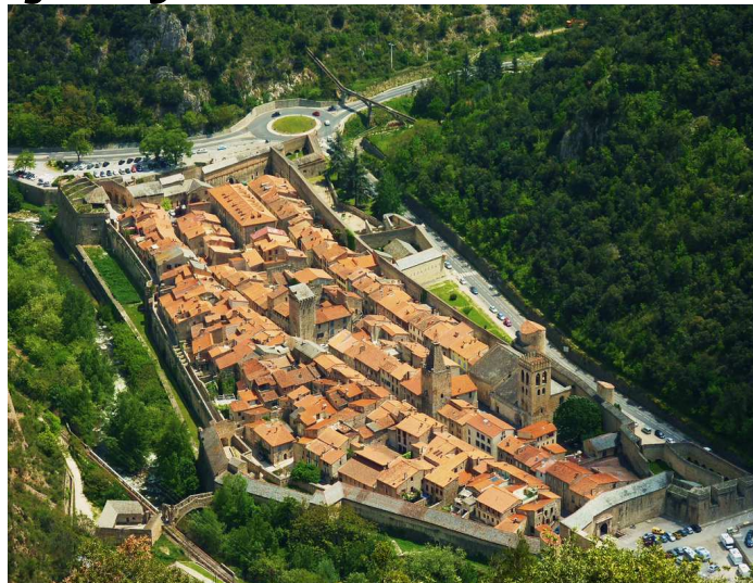
La ciutat murallada de Vilafranca de Conflent

Itinerari: Sortida amb autocar a TRES QUARTS DE SET DEL MATI (6h. 45min.) , davant de l'estació del carrilet, en direcció a la Cerdanya, parant per esmorzar (no inclòs en el preu). En acabar l'esmorzar ens dirigirem cap a Mont-Louis (França) on agafarem el Tren Groc, fent un recorregut impressionant i espectacular fins arribar a la ciutat medieval fortificada de Vilafranca de Conflent, situada al cor dels Pirineus Orientals, al peu del Canigó i classificat com un dels pobles més preciosos de França. Farem una visita pels carrers de la bonica ciutat i després, amb autocar, anirem fins el restaurant per fer el següent àpat: