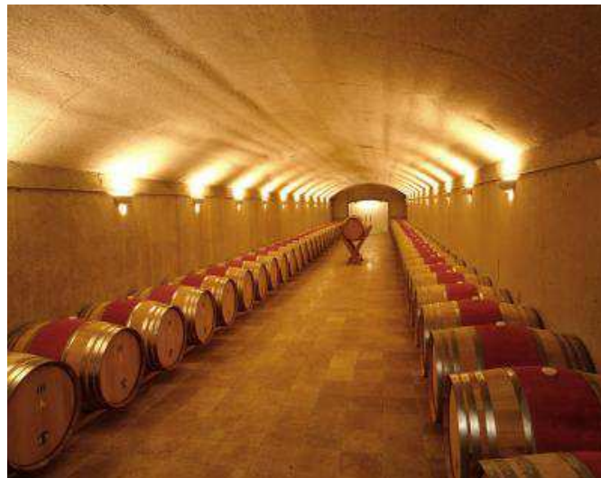
Vinyes i bodegues Torres

Itinerari: Sortida amb autocar a les vuit del matí de davant de l'estació del carrilet en direcció a la comarca de l'Anoia, parant per esmorzar (inclòs en el preu). Després d'esmorzar ens dirigirem les Bodegues Torres de Pacs del Penedès, per fer una visita guiada amb trenet. A l'hora de dinar tornarem al restaurant, on farem el següent àpat: