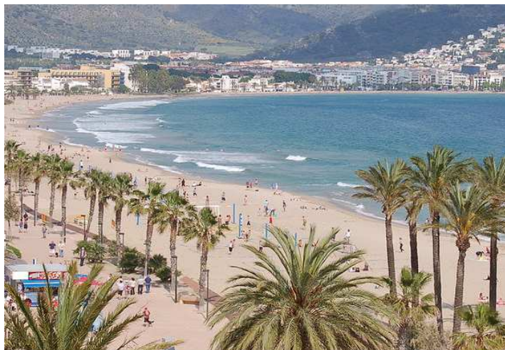
Baia de Roses

Ben dinat, i després d'una mica de sobretaula, ens arribarem fins el Aiguamolls de l'Empordà per fer una visita on podrem contemplar, des de diferents punts d'observació, tota la fauna i la flora d'aquest preciós espai. Després de tot això reprendrem el viatge de tornada fins a Sant Boi, per arribar sobre les set del vespre.