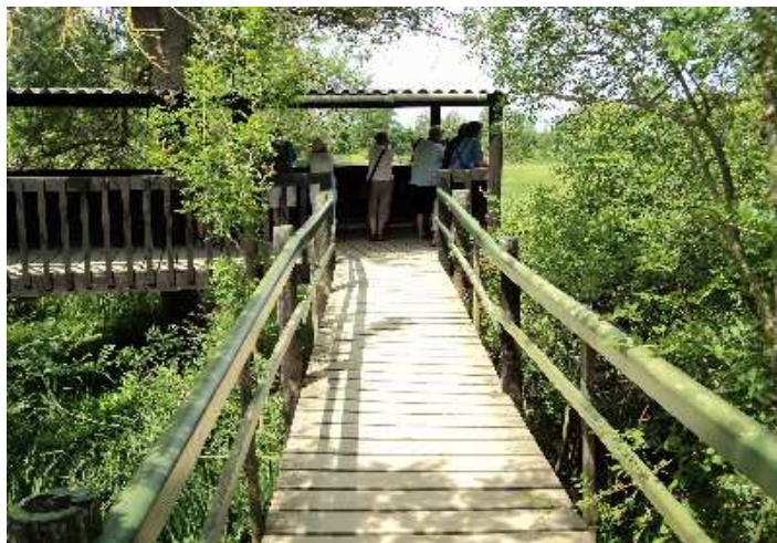
Un dels punts d'observació dels Aiguamolls

Preu (inclòs viatges, dinar i visites): socis 35€ / No socis 38€