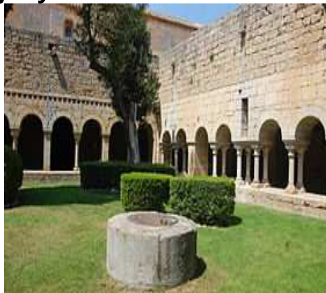
Exteriors de la Canònica de Santa Maria de Vilabertran i claustre

Itinerari: Sortida amb autocar a les vuit del matí, de davant de l'estació del carrilet, en direcció a Figueres, parant per esmorzar en un àrea de l'Autopista (a compta de cadascú) fins arribar al poble de Vilabertran per fer una visita guiada per la Canònica de Santa Maria, que és un magnífic conjunt monumental nascut com a canònica agustiniana. Està compost d'una església de tres naus amb campanar llombard i un claustre del segle XII. Cal destacar la creu d'orfebreria catalana del segle XIV situada a l'església. Després ens dirigirem a Roses on farem una visita panoràmica i al restaurant on ens prepararan el següent àpat: