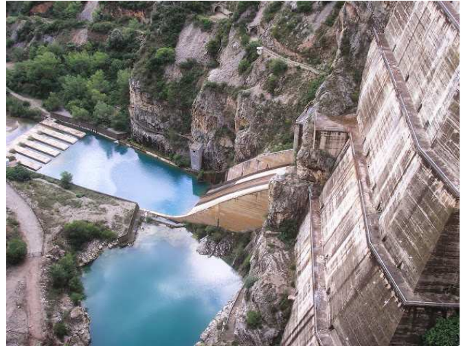
Vista de la presa de contenció des de la coronació

Itinerari: Sortida amb autocar a dos quarts de vuit del matí , de davant de l'estació del carrilet, en direcció a Balaguer, parant per esmorzar (no inclòs en el preu). Prosseguint, després, fins el peu de la presa de Canelles on, en el Centre d'Interpretació de l'Energia, ens explicaran que és l'energia, que són les energies alternatives o renovables i quina és la dependència energètica del país, formes d'estalvi i futur de les mateixes. També veurem les característiques de la central fent una visita guiada per fora i per dins. Central, que per la seva magnitud i espectacularitat es una de les més importants de la península. A través d'un recorregut per tota la instal·lació, presa, túnels, pou de turbines, sala d'alternadors, sala de control, sala de transformadors, parc de distribució, obra civil, maquinaria instal·lada, etc. podrem veure les seves particularitats, característiques i funcionament de la mateixa. Després ens dirigirem a un típic restaurant d'Estopiñan del Castillo (Aragó) per fer el següent àpat: