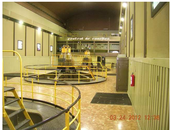
Vista de les turbines de l'interior de la central

Per a inscripcions a la llibreria Isart: a partir del dia 14 d'octubre.