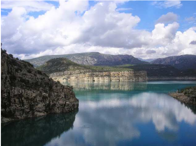
Vista de l'embassament de Canelles