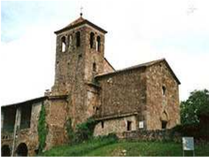
Ruta del romànic per la Vall de Bianya