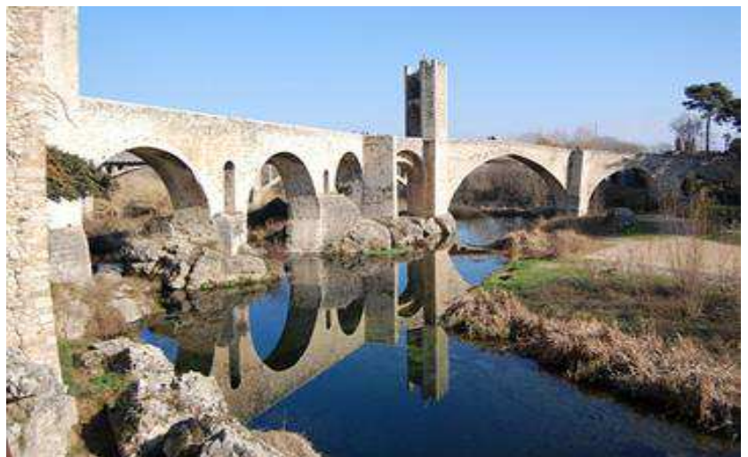
Pont de Besalú

Per a inscripcions a la llibreria Isart: a partir del dia 28 de maig. (els que van venir al viatge a Tarragona podran apuntar-se el dia 27 de maig)