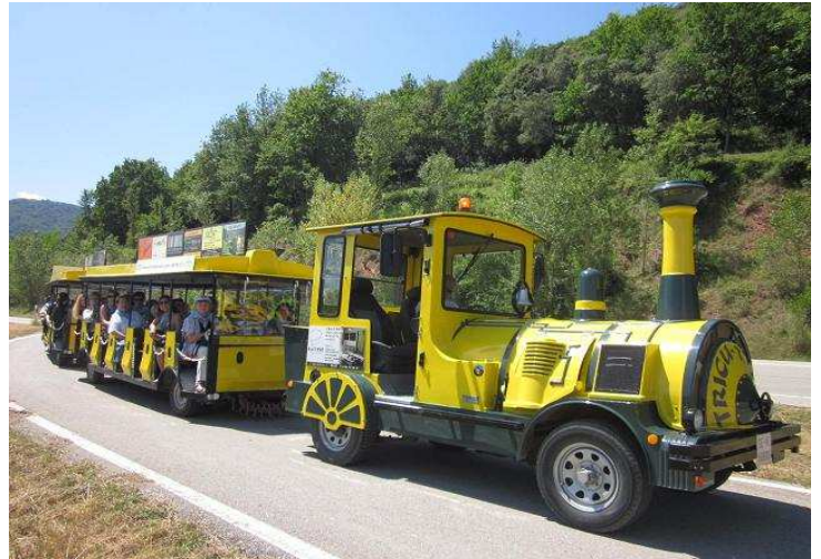
Trenet "Tricu Tricu"

Itinerari: Sortida amb autocar a les vuit del matí de davant de l'estació del carrilet , parant per esmorzar a La Gleva (inclòs en el preu) i continuant el viatge pels túnels de Bracons, cap a Olot i la vall de Bianya, per fer una visita guiada amb el trenet "Tricu Tricu" pels llocs més interessants de la vall i les seves esglésies romàniques. Acabada la visita anirem al restaurant per fer el següent àpat: