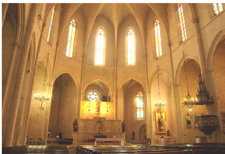
Interior església de Montblanc

Calçots amb salsa romesco i carxofes - xai a brasa i llonganissa amb allioli i guarnició - vi blanc i negre, aigües, cava, postres, cafè i licor