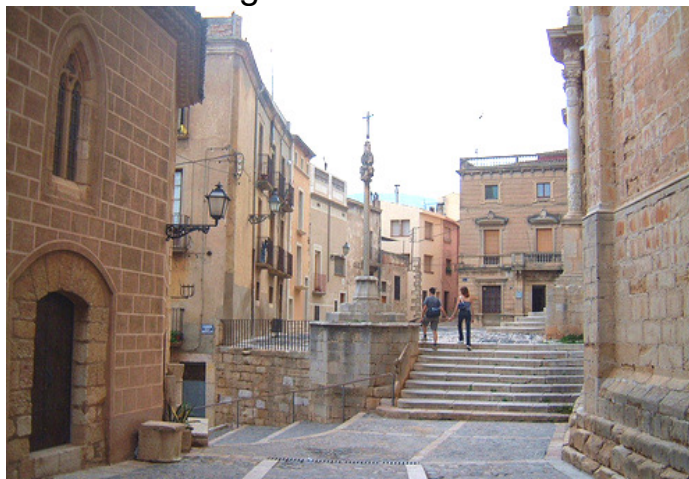
Nucli antic de Montblanc

Itinerari: Sortida amb autocar a les vuit del matí de davant de l'estació del carrilet en direcció a la Conca de Barberà, parant per esmorzar (a compte de cadascú) .