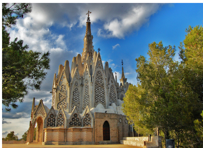
Santuari de Montserrat (Montferri)

Acabat el dinar, després d'una petita sobretaula, i si fa bon temps, anirem cap a Montferri per veure el Santuari de Montserrat, construït pel deixeble de Gaudí: Josep Maria Jujol. Un cop finalitzada aquesta visita tornarem cap a Sant Boi, onensem arribar prop de les set del vespre.