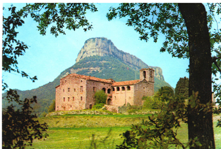
La mateixa cinglera del far des de Sant Martí de Sacalm

Per a inscripcions a la llibreria Isart: socis (titular i 3 acompanyants) a partir del dia 13 d'octubre i, del dia següent, tothom qui vulgui venir.