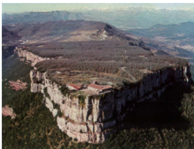
Vista general del Collsacabra i la cinglera del Far

En acabar el dinar, després d'una mica de sobretaula i d'estirar les cames pels vols del Santuari, veurem la magnífica vista del pla de Sant Martí de Sacalm. Després reprendrem el viatge de tornada fins a Sant Boi, per arribar al vol de les 7 de la tarda.