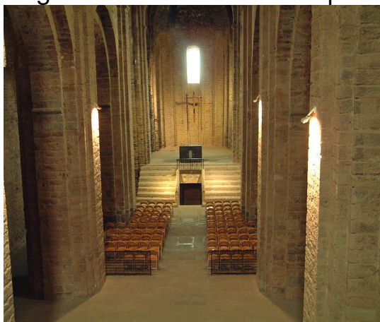
Interior de la Col·legiata de St. Vicenç

Després de dinar i de la sobretaula anirem a visitar El Santuari del Miracle després de la seva recent restauració. Un cop acabada la visita reprendrem el viatge de tonada a Sant Boi per arribar prop de les set de la tarda.