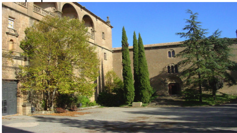
Santuari del Miracle

Preu (inclòs viatges, dinar i visites): socis 32 € / No socis 35€