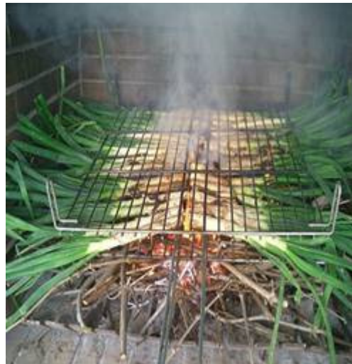
Calçots de la calçotada

Itinerari: Sortida amb autocar a les vuit del matí , de davant de l'estació del carrilet, en direcció a la comarca d'Osona, on esmorzarem (inclòs en el preu). Ben esmorzats ens dirigirem a Vic, capital de la comarca, per fer una visita guiada pels llocs més emblemàtics de la ciutat i l'interior de la Catedral. Després de les visites continuarem el viatge cap a la subcomarca del Moianès, per fer un excel·lent dinar – calçotada, a Montvi de Baix. Acabada la sobretaula prosseguirem el viatge per la carretera que va des de Moià a Navarcles, per gaudir d'un magnífic paisatge. A partir de Navarcles podrem veure zones inèdites del Llobregat, passant pel Pont de Vilomara, per l'aiguabarreig del Cardener amb el Llobregat, fins a Sant Vicenç de Castellet i, des d'aquí, fins a Sant Boi, on pensem arribar prop de les set de la tarda.