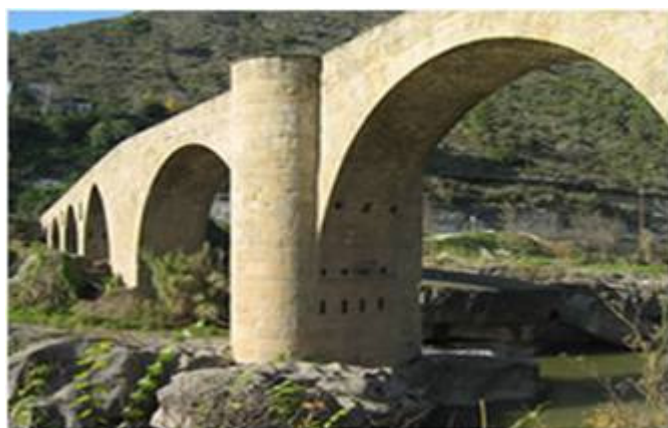
Pont del Pont de Vilomara

Per a inscripcions i pagament a partir del dia 16 de febrer: