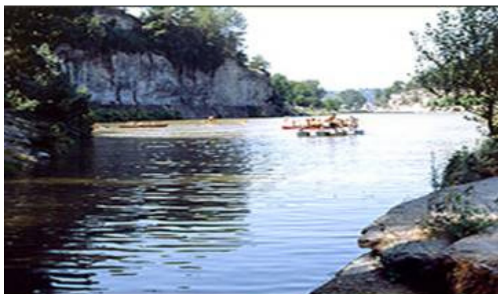
Llac de Navarcles

Itinerari: Sortida amb autocar a les vuit del matí , de davant de l'estació del carrilet, en direcció a la comarca d'Osona, on esmorzarem (inclòs en el preu). Ben esmorzats ens dirigirem a Vic, capital de la comarca, per fer una visita guiada pels llocs més emblemàtics de la ciutat i l'interior de la Catedral. Després de les visites continuarem el viatge cap a la subcomarca del Moianès, per fer un excel·lent dinar – calçotada, a Montvi de Baix. Acabada la sobretaula prosseguirem el viatge per la carretera que va des de Moià a Navarcles, per gaudir d'un magnífic paisatge. A partir de Navarcles podrem veure zones inèdites del Llobregat, passant pel Pont de Vilomara, per l'aiguabarreig del Cardener amb el Llobregat, fins a Sant Vicenç de Castellet i, des d'aquí, fins a Sant Boi, on pensem arribar prop de les set de la tarda.