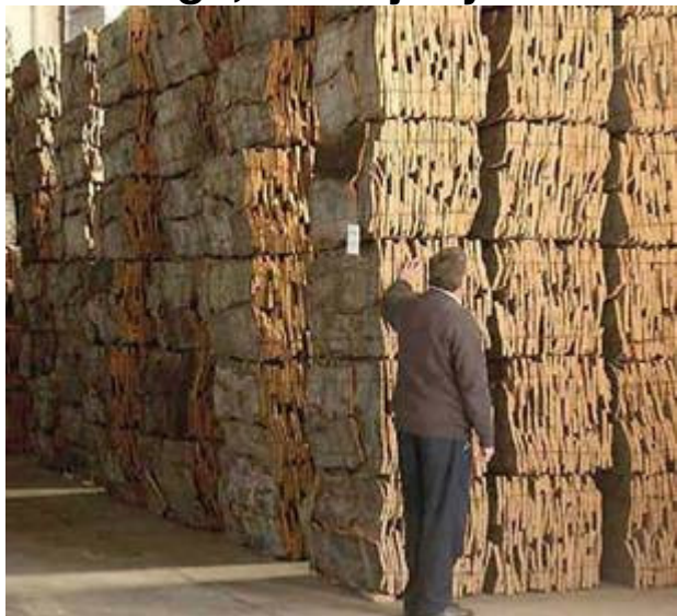
Indústria del suro

Diumenge, 15 de juny 2008 El preu inclou: Viatge dinar i visites guiades