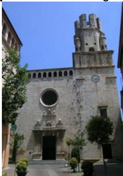
Església de Sant Martí de Palafrugell