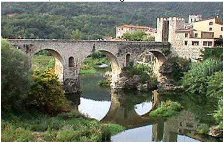
Pont romànic sobre el Segre

Itinerari: Sortida amb autocar a les 8 del matí, de davant de l'estació del tren de Sant Boi, en direcció a Bagà i el túnel del Cadí, parant per esmorzar (a compte de cadascú) prosseguint el viatge cap a Arsèguel, on visitarem una antiga fàbrica de filatura i teixit de llanes. A l'hora de dinar ens dirigirem al restaurant per fer el següent àpat: