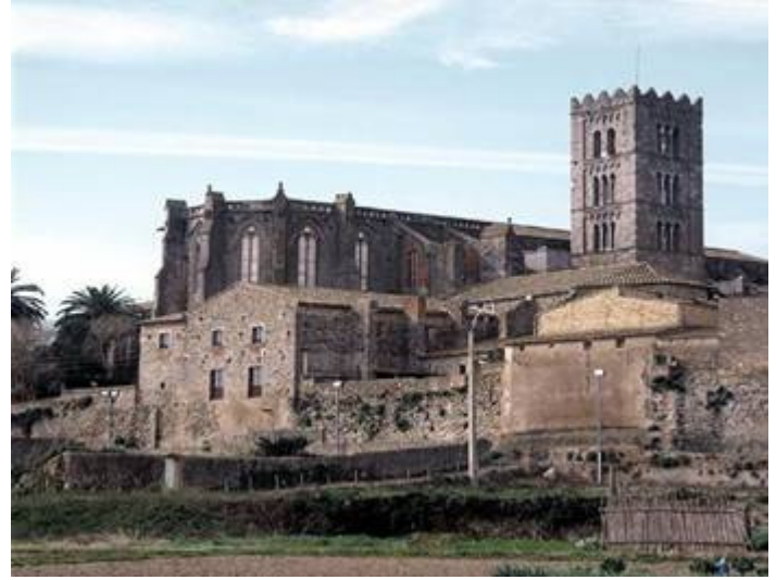
Basilica de Santa Maria i Muralles de Castelló d'Empúries

Itinerari: Sortida amb autocar a tres quarts de vuit del matí, de davant de l'estació del carrilet, en direcció a Figueres, parant per esmorzar (a compta de cadascú). Després agafarem la carretera que va des de Figueres a Roses, on trobarem la vila de Castelló d'Empúries (antiga capital del comtat). En companyia d'una guia local farem unes visites guiades pels llocs històrics de la localitat: convents, presó, antiga farinera i per a la Basílica de Santa Maria, a la qual, els Comtes de Barcelona, van atorgar-li la condició de temple d'estructura catedralícia. Després ens dirigirem al restaurant on farem un variat àpat: